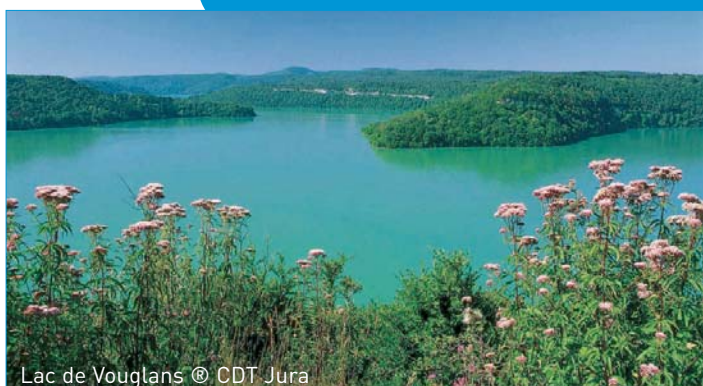
Lac de Vouglans

Le département du Jura affirme sa volonté d'accroître son activité groupes.